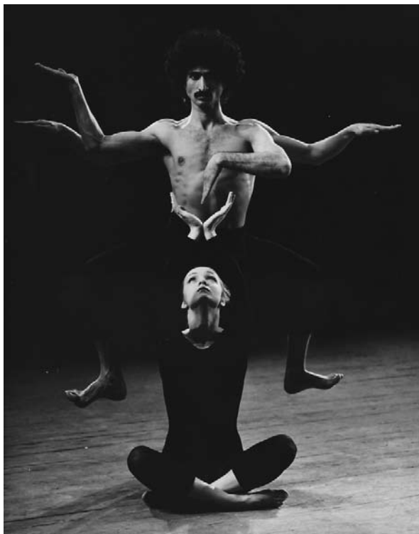
Relációk II Koreográfus: Kricskovics Antal Budapest Táncegyüttes

az egyén belső tusakodását vetíti ki három szereplőre. Az alkotó a maga teremtette, sajátos mozdulatnyelvén keresztül le nem győzhető indulatokat, nyugalmat, sóvárgó érzelmeket, és tétova kétkedéseket egyaránt érzékeltet. A mű egyik legszebb pillanata, amikor a három, egymástól markánsan különböző karakterű táncos mintegy a madarak szárnyalását utánozva lebegnek, majd a feszült csendben hirtelen szétrebbenve ismét egymásnak feszülve folytatják ellentétekkel terhes, mégis sok tekintetben szorosan összefonódó táncukat, életüket.