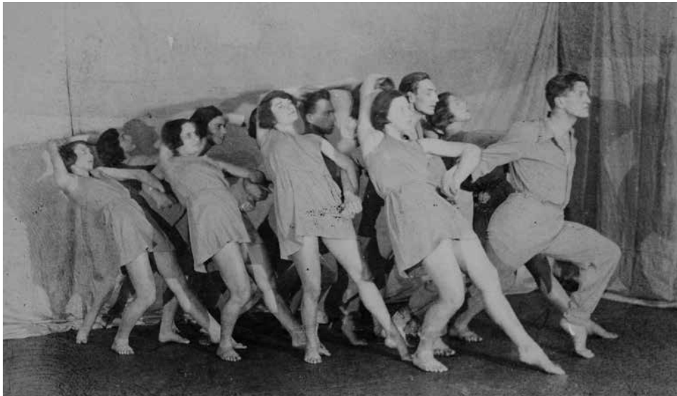
A Bilincsek mozgásdráma Bilincsek tétele. MTA BTK Művészettörténeti Intézet, Adattár, Palasovszky Ödön hagyatéka., MKCs-C-I-107 (Kövesházi Ágnes hagyatékában is megtalálható.)

1/ A játék kezdetén a középsők előre fűrészelnek, és törzssel srégen nyújtóznak előre, ugyanekkor a szélsők hátra fűrészelve erősen hátra dőlnek úgy, hogy a középsők feje mindig az előttük állók összekulcsolt karjai alatt nyúljon előre. Ügyelni kell, hogy az egymásba karolók alkarjai állandóan hegyes szöveget alkossanak a felkarokkal, és így a karizmok teljes energizációjával szilárdan tartásuk egymást. Most a mozgás felcserélődik, a középsők fűrészelnek hátradőlve hátra, a szélsők srégen előrenyújtózza, előre, úgyhogy a feltartott karjuk az előttük álló középsőknek feje fölött nyújtózik előre. Ebből a helyzetből mindenki lép előre a bal lábával, újra előbb a középsők fűrészelnek előre, azután csere. /A fűrészek úgy történnek, hogy először a rüsz nyomódik előre, ezt követi lassan a térd, majd a comb és végül a medence. A hátra fűrészeléseknél lehetőleg szintén legyen előre nyomva a rüsz./ Ez a váltakozó mozgás /előre-hátra fűrészt/ négyszer ismétlődik: egyszer a kezdőállásból lépés nélkül, azután háromszor lépéssel /bal-jobb-bal láb/ mégpedig úgy, hogy minden lépésnél egy fokkal mélyebbre fűrészelnek.