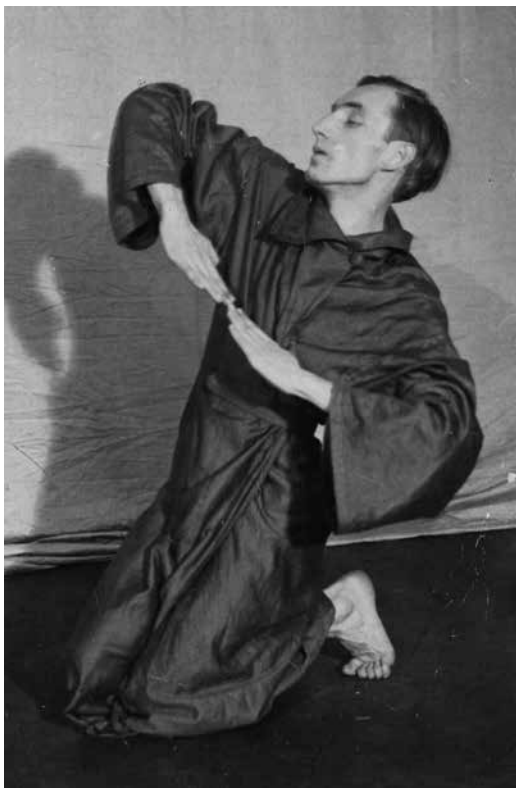
MTA BTK Művészettörténeti Intézet, Adattár, Palasovszky Ödön hagyatéka., MKCs-C-I-107 (Kövesházi Ágnes hagyatékában is megtalálható.) A képek összegyűjtését Vincze Gabriella végezte.

fázisáig. /Négy taktus bevezető zene. 3/4-es taktusok./