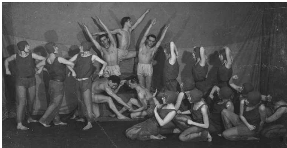
A Bilincsek mozgásdráma A gép hatalmában tétele. MTA BTK Művészettörténeti Intézet, Adattár, Palasovszky Ödön hagyatéka., MKCs-C-I-107 (Kövesházi Ágnes hagyatékában is megtalálható.)

6 taktuson át csak az első csoport van a színen. A csoport tagjai szimultán végzik mozgásaikat úgy, hogy az összehatás egy egységes mechanizmus benyomását adja.