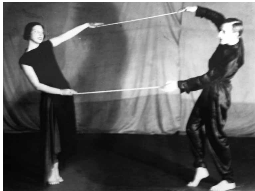
A Bilincsek mozgásdráma Egymás rabjai tétele. MTA BTK Művészettörténeti Intézet, Adattár, Kövesházi Ágnes hagyatéka., MDK-C-I-165.

1/ Lélegzetük egygyé forrt ritmusában kezdődik a játék. Így emelkednek és süllyednek alig észrevehetően a vállak. Aztán a külső tenyerek, majd a belsők. A csuklók játéka egy leheletszerű fordulatot indít. Váll a vállhoz, mell a mellhez, halánték a halántékhoz simulva fordulnak a színpad bal oldala irányába. Az asszony visszacsukló bal tenyere szelíden simul a férfi jobbja alá, másik karjuk egy halk lépéstől követve, lassan előrenyúl, majd visszaimbolyog egymáshoz tapadó tenyerük és csuklójuk játékaival. A csuklók és könyökök szenvedélyes játéka újra visszahozza őket egymással szembe, szemeik lassan felnyílnak, és egymás tekintetébe mélyednek. A csuklók most egymás felé törnek, majd szétválnak, de párujuktól nem tángítanak. Tört ritmusuk gyorsul, a belső tenyerek 3 előre-hátra váltakozó szaggatott csuklójajlással fölfelé siklanak, végül egy csusszanással