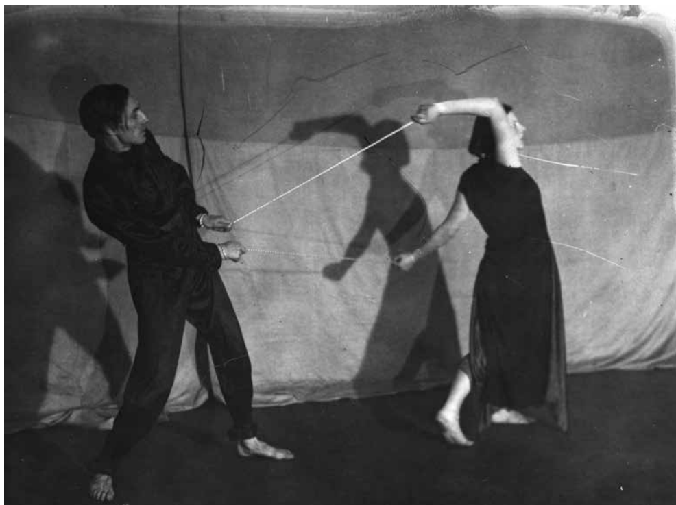
A Bilincsek mozgásdráma Egymás rabjai tétele. MTA BTK Művészettörténeti Intézet, Adattár, Kövesházi Ágnes hagyatéka., MDK-C-I-165.

látható kötelék elszakad, lehull, de a férfi és a nő mégis összetartoznak egy láthatatlan belső köteléssel.