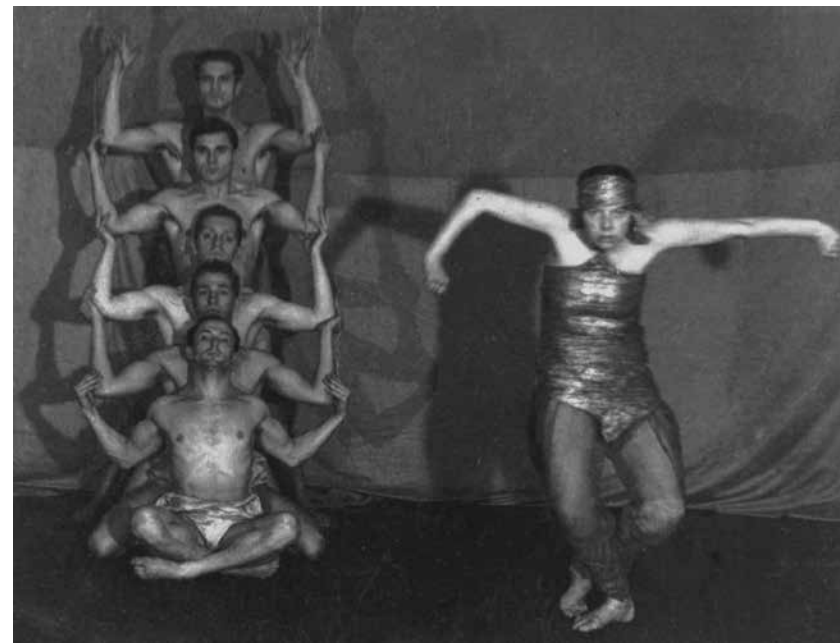
A Bilincsek mozgásdráma Bálvány című tétele. MTA BTK Művészettörténeti Intézet, Adattár, Kövesházi Ágnes hagyatéka., MDK-C-I-165.

Az egész bálvány energizáltsága megingathatatlan merev kötömb benyomását keltse. Így áll a bálvány mozdulatlanul a kompozíció végéig, amikor a táncosnő végső erőfeszítésére a bálvány meginog, és egyre erősödő kis ingásokkal /frontális síkban jobbra-balra/