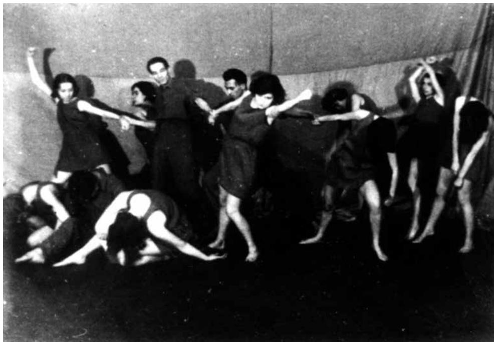
A Bilincsek mozgásdráma Bilincsek tétele. MTA BTK Művészettörténeti Intézet, Adattár, Palasovszky Ödön hagyatéka., MKCs-C-I-107 (Kövesházi Ágnes hagyatékában is megtalálható.)