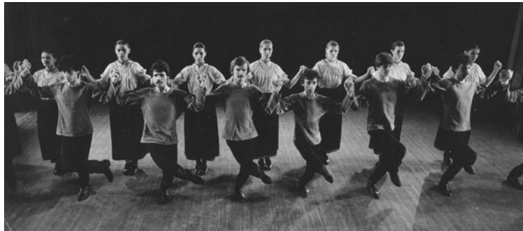
3. ábra: Györgyfalvy: Lánc

A megteremtett szabad idő és szabad tér keretein belül azzal kísérleteznek, ami megadatott nekik: néptánc és népzenevel. Míg Szigeti a történeti néptáncból kifejthető drámai potenciál, addig Györgyfalvy Katalint a néptánc formáiban (körtánc, kapuzás, lánc, szóló-, páros-, csoportos tánc) rejlő lehetőség foglalkoztatja. Györgyfalvy azt keresi, mit üzen a nézőnek a láncban szigorúan ugyanazt a mozgássort kivitelező 20 fős együttes és egy közülük kiváló, lépést tévesztő „szóló” a kollektíva, a kommuna országában? Vajon milyen ereje van a zárt karlánccal összefűző lánygyűrűnek, milyen a nyomora közepébe állított egynek? (Lásd. 3. ábra) Hogyan lehet a néptánc hagyományos, tehát adott formáival akár nagyobb közösségekről és az ahhoz kapcsolható (politikai) témákról, vagy éppen az egyén, a magánélet problémáiról az adott szabályozott formákkal, test és mozdulatkombinációkkal szólni? Bartók egyik Mikrokozmosz darabjára készített Bújócska című koreográfiája látszólag egyszerű lépés és karkombinációkból építkezik. Tíz egyenruhás, egyen arcú lány tükröt és takarást formáló kezeikkel, egyen ritmusú bokázó lépéseik monotonijába robban be a szerelmi kalandot kereső fiú. A koreográfia nemcsak felül a bartóki zene kínálta lehetőségekre, hanem egyenrangú társává válik. Zene és tánc immáron nem egymás illusztrációja, hanem tökéletes egység, mely együtt teremt meg a színpadi etűd csomópontjait, feszültségét és oldását.