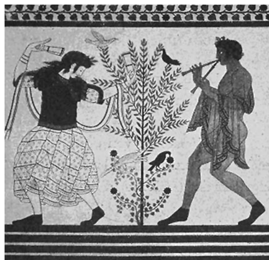
Kasztanyettás táncosnők fuvolás táncossal. A cornetoi Tomba del Triclinio falfestménye. (Weege, 208. kép.) 68

Őszinte természetérzés, nagy öröm és a halottkultusznak valami egészen sajátos jellege bontakozik ki előttünk ennek a táncos népnél nagy gimnasztikai iskolát eláruló táncábrázolásából.