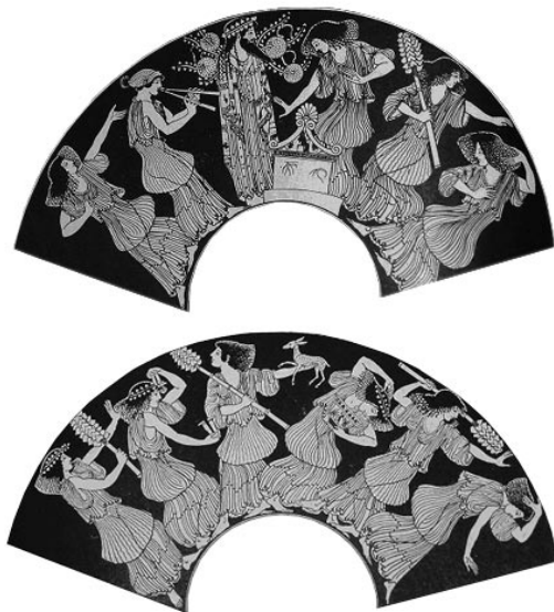
A berlini Hierón-váza, mely Dionüszoszt, oltárát és a menádokat ábrázolja ekasztikus tánc közben. (Lásd: Weege 103. és 105. képét egy diapozitívra kopírozva.) 28