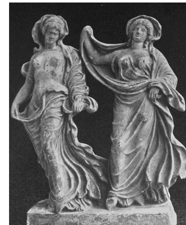
Köpenytáncot táncoló két nő. (Weege, 84. kép)

Apollót, Pallaszt méltóságos ünneplő táncokkal dicsőítették; oltáraik körül egymás csuklyájába, vagy ruhájába fogódzva lejtették a táncot. Apollót a gyorsritmusú lírához simuló hüporchémákkal tisztelték, melyekhez olyan költők, mint Pindaros, Szimonidesz szerették a beszédritmusokat. Ilyen volt pl. a thébaiak számára Kr. e. 463-ban történt napfogyatkozásról írott tánc, az ún.