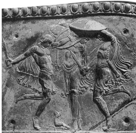
Pyrrikhé (Weege, 42. kép) 9 Ez a képünk egy krétai eredetű harci táncot, a pürrikhét ábrázolja: fegyverek zajával védik Rhea gyermekét Zeusz haragja ellen. 10

Az egyiptomi 2 lélek sajátos jellegénél fogva csak távolról érezte a táncnak azt a másik sajátosságát, amely a görögség életében jutott hiánytalan megvalósulásra. Az egyiptomi 3 tánc a hétköznapi élet mozdulatkincsétől élesen elválasztott istentisztelet volt, de benne sohasem oldódott föl maradék nélkül az egyiptomi lélek. 4 Inkább csak lemérte, érzekelte azt a távolságot, amely a földi létet az istenség világtól elválasztja. Az antropomorf isteneket életre hívó 5 görögség a tánc révén szükség-szerűen egyesülni tudott ezzel 6 a földi mintára elképzelt isteni világgal. Ha a ritmikus mozdulat révén egy magasabb rendű létezés szféráiba tudunk hatolni, akkor ennek a magasabb rendű világ-nak a mindennapi mozgása nem lehet más, mint a tánc . A görög felfogás és élethit szerint a tánc az istenek hétköznapija . És valóban, Zeusz, még a komoly Pallas Athéné is táncolt, nem szólva a Hórákról, Gráciákról, és a Múzsákról. A valóság fölötti isteni létezésnek annyira 7 a tánc a mozgás-ban kifejeződő életformája, hogy a 8 görög mitológia szerint a tánc menti meg a létezés számára az emberiséget . Rhea istennő táncal bírja rá Kronoszt, hogy ne falja fel gyermekeit.