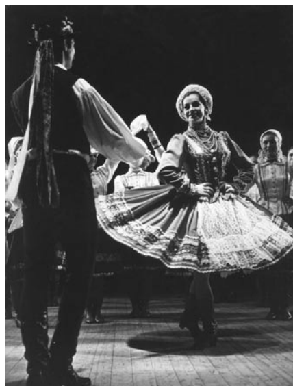
1. ábra: MÁNE – Ecseri lakodalmas

meg a burzsoá elit kulturális monopolhelyzetét, 12 ahol a munkások és parasztok kultúrája végre megmutatkozási lehetőséget kell, hogy kapjon – a színpadon ennek a paraszti tánc kultúrájának teljes tagadását mutatja a szovjet minta. Igor Mojszejev 1937-ben hozza létre tánckarát. Műveiben a klasszikus (orosz technikájú) balett karaktertáncait színesíti akrobatikus, valamint népies színjátéki elemekkel, s a színpadi giccsről sem riad vissza.