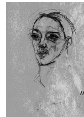
Oskar Kokoschka: Vaclav Nizsinszkij. Ceruzarajz (Bécs, 1912. június 20.). Magángyűjteményben.

Biztosítom nagyrabecsülésemről. Az Ön Oskar Kokoschkájá