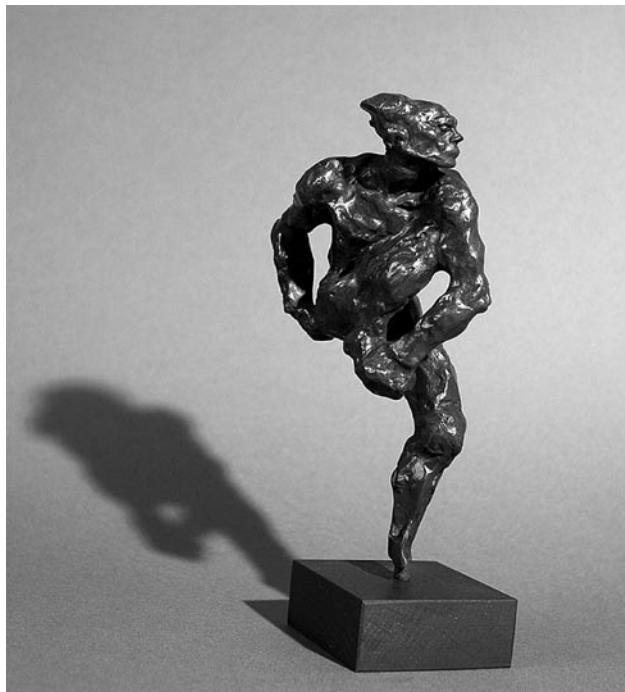
A. Rodin: A táncos ( Nizsinszkij , bronz, 1912?) Rodin Múzeum, Párizs