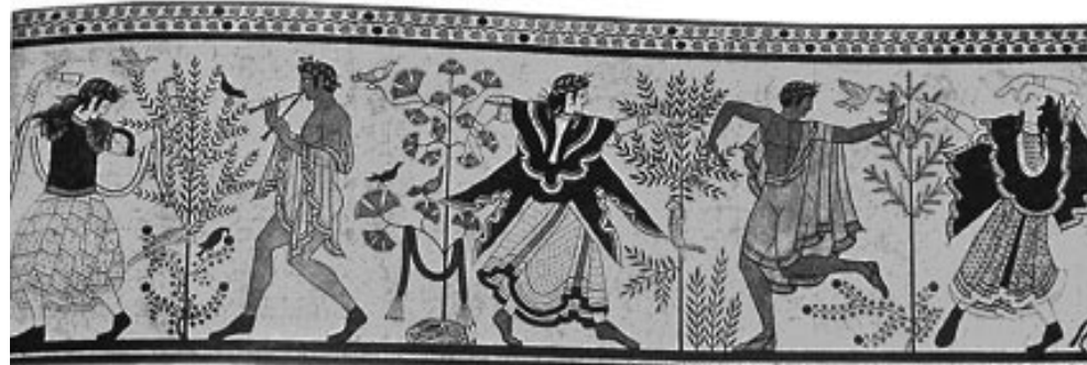
Táncosnők és táncosok sora. Falfestmény a Tomba del Triclinio-ban, Corneto-ban. (Weege, 201.) 67

alakok a halál mozdulatlanságának házába az élet örömét vitték. A Tomba dei vasi dipinti , vagy a Tomba delle Caccia e pesce és a Tomba del Morto falán festett alakok lebegő, 66 áttetsző ruhákban, vagy alig öltözött citerák és kasztanyettek hangjai mellett lebegnek.