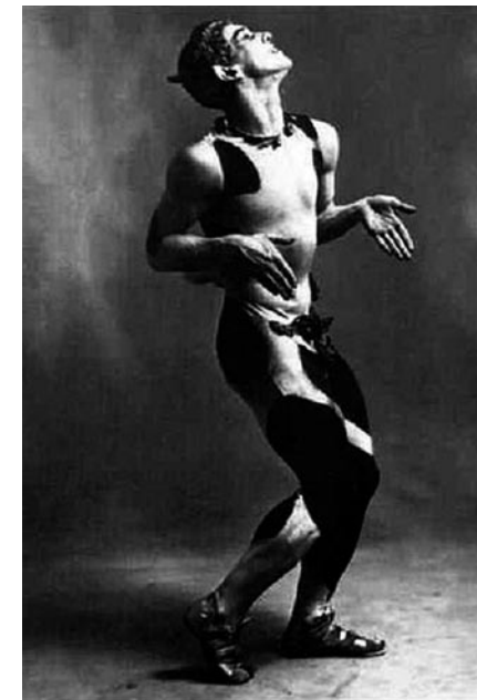
Nizsinszkij a Faun szerepében

Odilon Redon 3 szintén 1912-ben, Gyagilevhez írott nyílt levelét elsősorban a festőt Mallarmé-hoz fűződő barátságáért motiválta. Ugyanakkor ez a levél is tükrözi a látásmód érzékenységét, amely az ekkor már elismert és köztiszteletben álló művész elismerő gondolatait még értékesebbé teszi.